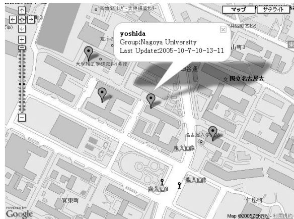
図4 登録したユーザの位置情報リアルタイム表示例

本サービスの応用として、マップ上にメッセージ等のオブジェクトを埋め込むことを考えている。自身の行動範囲に作業等のメモを記録する利用方法や、事故情報や工事情報等の進行方向に問題がある場合の予告としての利用方法等、位置と共に時間にも依存したサービス[5]が考えられる。また、ユーザの作成した、より詳細な地域マップを埋め込むことによる、地図機能の向上も考えている。